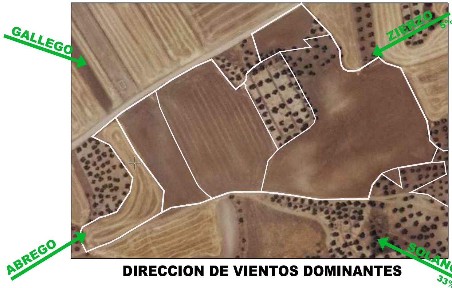
DIRECCION DE VIENTOS DOMINANTES

FRECUENCIA DE LA DIRECCION DEL VIENTO EN TODO EL AÑO