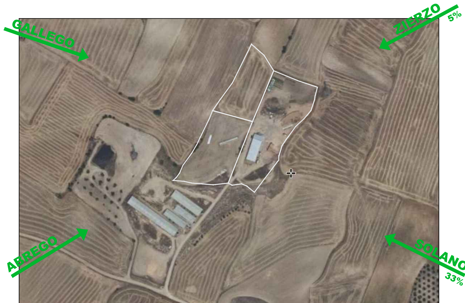
DIRECCION DE VIENTOS DOMINANTES